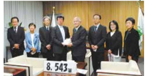
21年11月議会に「ゆきとどいた教育をを求める富山の会」が請願署名を提出