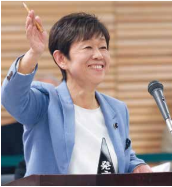
3/17予算特別委員会で質問

3月24日まで開催された2月定例県議会。就任2年目に入った新田知事が提案した予算案は、国の社会保障費抑制を無批判に具体化するなど問題点を含む一方で、日本共産党が働きかけてきた様々な要望にも予算がつきました。