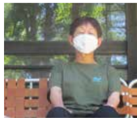
21年7月、有峰「山仕事の集い」に参加(Tシャツにはハクバサンショウウオのマークが)

農業用肥料の小さなプラスチック皮膜が、県内の海岸に流れ着く問題。農業研究所がプラの代わりに、硫黄や他との混合物を使う研究に取り組んでいます。